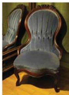
Kate Morrison, Transposition , 2013. Installation techniques multiples. 2 x 3 x 4 m. Chaise bleue, photographies et écriture cartographique, écriture sur pellicule transparente. Ebénisterie : Irène Bauknecht. Rembourrage : Louise Longpré © Kate Morrison